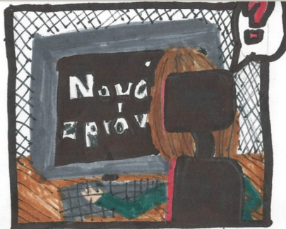
A když jednou hrál tak mu přišla zpráva z neznámého čísla.