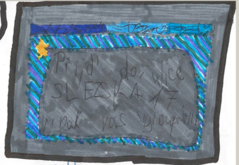
Tohle je ten dopis!