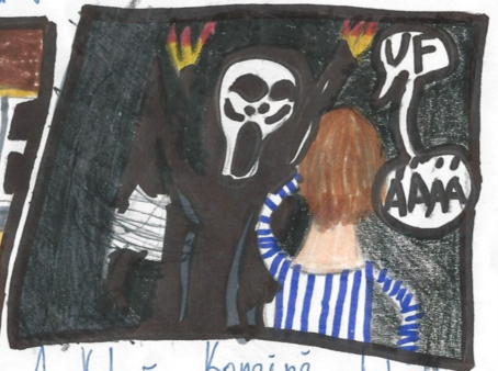
A když konečně došel čekalo ho nemilé překvapení!