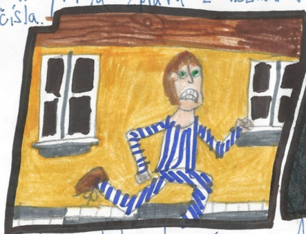
Michal běhal celou večer ve spletných uličkách Prahy.