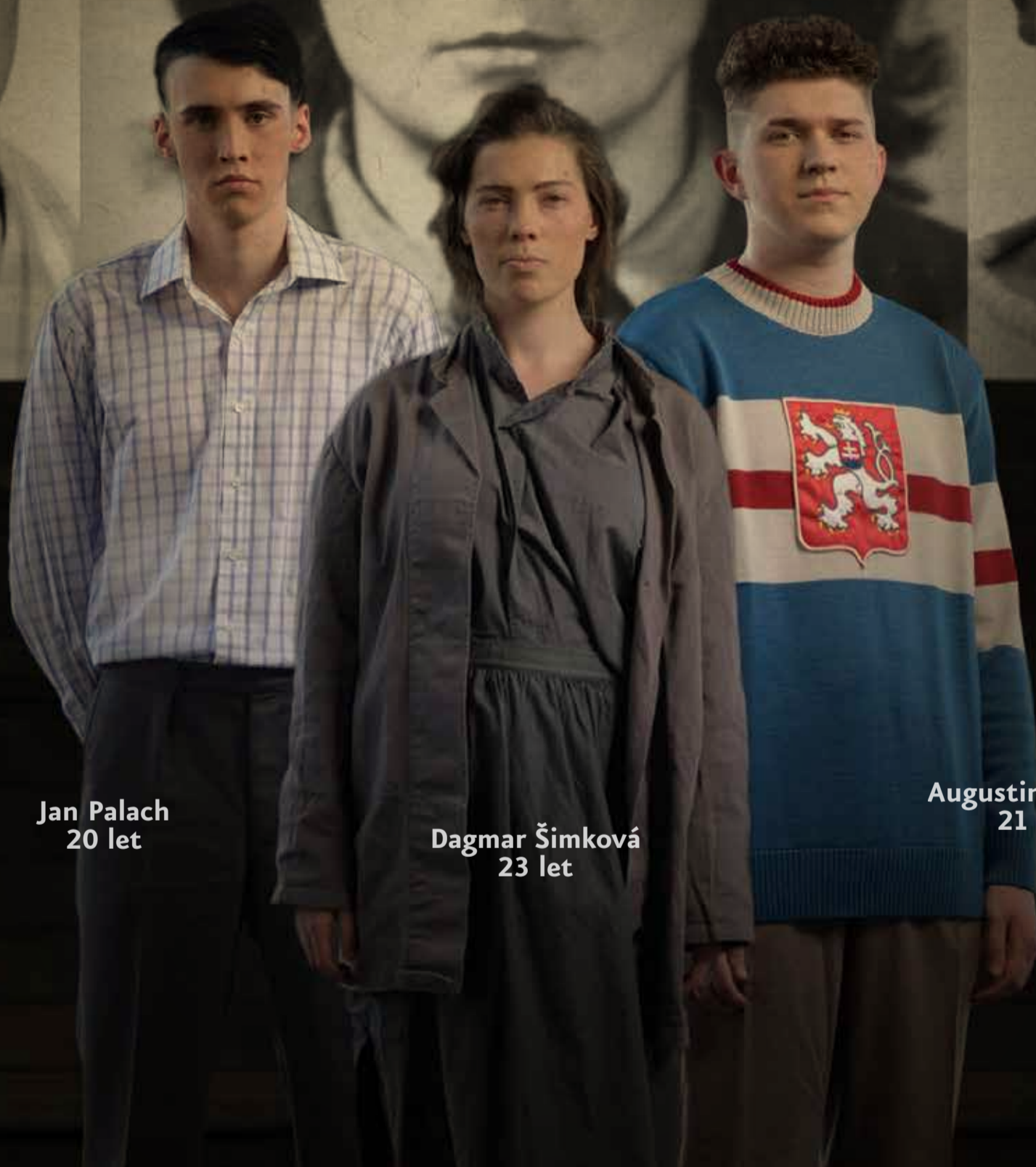
Jan Palach 20 let