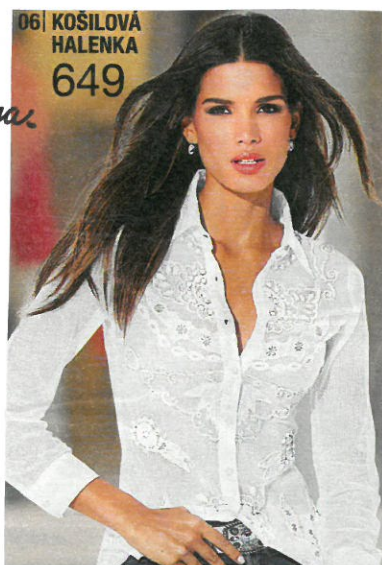
Ich finde die Bluse (so) sehr schön.