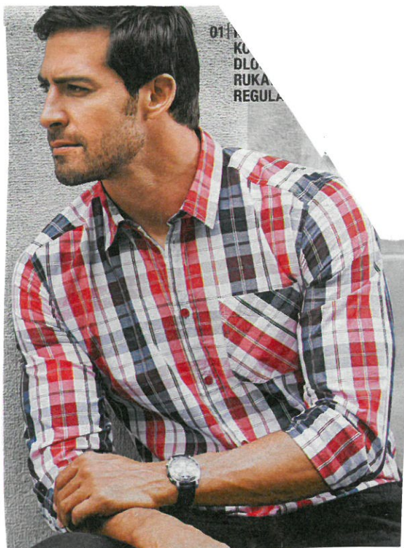
Ich finde das Hemd gut.