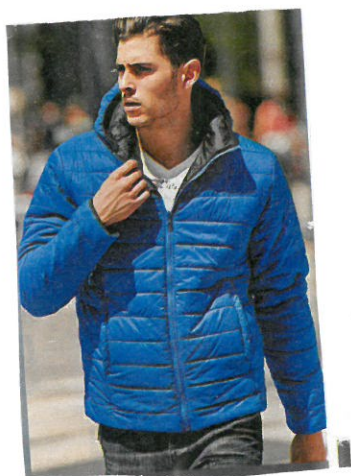
Ich finde die Jacke prima.