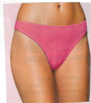
Ich finde die Unterhose nicht schön.