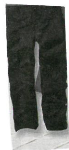
Ich finde die Hose ganz nett.